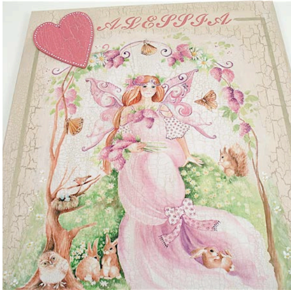
Dècoupage pittorico con carta di riso "Diana" la fata dei fiori

iscriviti alla newsletter To-do e riceverai una scheda progetto alla settimana www.to-do.it