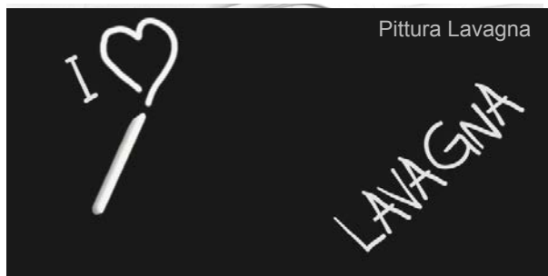
Tavola rettangolare cod. 94678 Sagoma Cuore n°6 cod. 66985 Whitebase To-Do cod. 68659 Rullo Spugna con manico cod. 90045 Pennello Hobby Lilla Piatto n° 20 cod. 91043 Spugne abrasive grana grossa cod. 90963 Pittura Lavagna cod. 11009 Pennello setola bianca per fondi S/H n° 30 cod. 90973 Pennello setola bianca per colla S/Y n°18 cod. 90970 Pennello Hobby Lilla Tondo n°4 cod. 91049 To-Do Fleur Mr Grey cod. 12011 To-Do Fleur Titanium White cod. 12001 Tessuto americano cod. 71334 Colla Tessuto To-Do cod. 91072 Forbici To-Do piccola retta cod.90920 Organza Bianco cod. 70321 Nastro adesivo